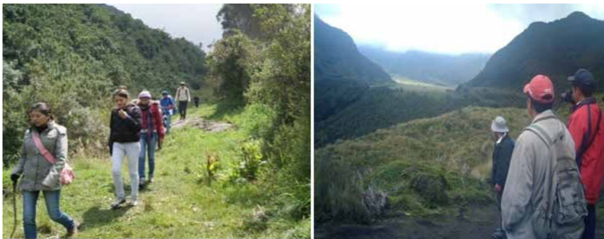
Sendero de la Lava de Carihuairazo

Nota. GADM-Mocha. (2017). Mocha: Sendero de Tradición y Deleite. Obtenido de Gobierno Autónomo Descentralizado Municipal de Mocha: http://www.municipiomocha.gob.ec/