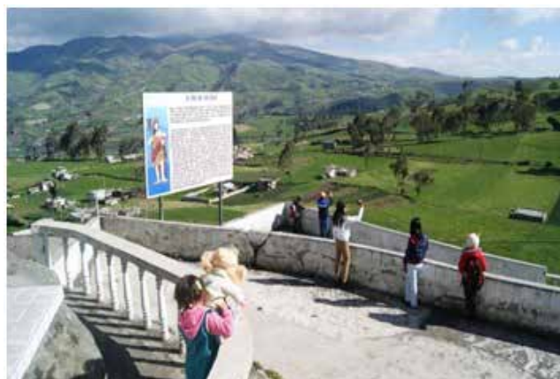
Mirador Pie de San Juan

Nota. GADM-Mocha. (2017). Mocha: Sendero de Tradición y Deleite. Obtenido de Gobierno Autónomo Descentralizado Municipal de Mocha: http://www.municipiomocha.gob.ec/